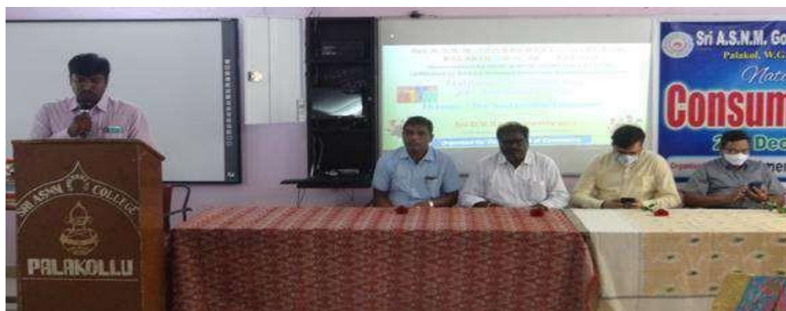
Lecturers Explained the importance of consumers day to the students.