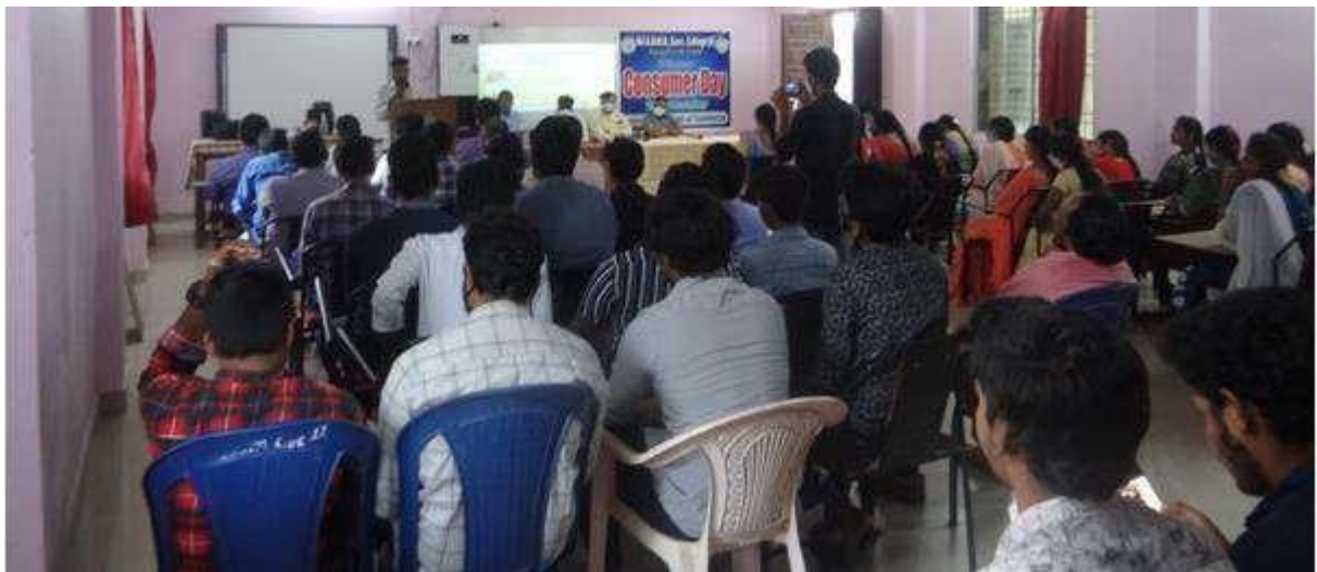
Students and staff participated in this program