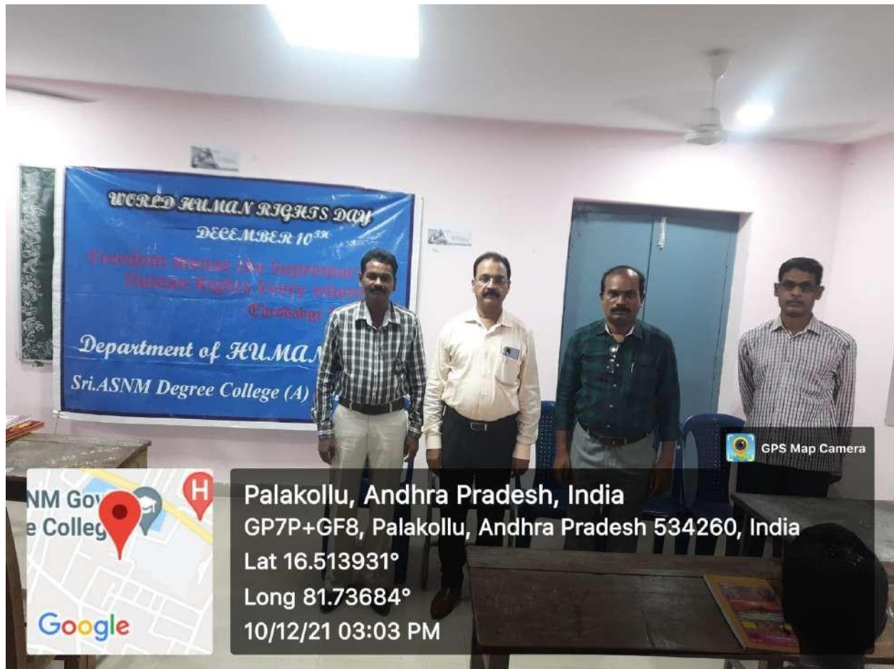
WORLD HUMAN RIGHTS DAY CELEBRATIONS ON 10-12-2021