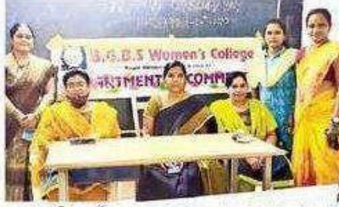
సమావేశంలో మాట్లాడుతున్న ప్రెస్మిపల్ అమృత

ఆన్లైన్ కొనుగోళ్లపై లవగాహన లవసరం పాలకొల్లు, న్యూస్టుడే: స్థానిక అడ్డె